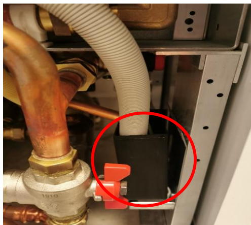
Närbild på spillkopp samt vattenslang som kan rengöras vid behov.