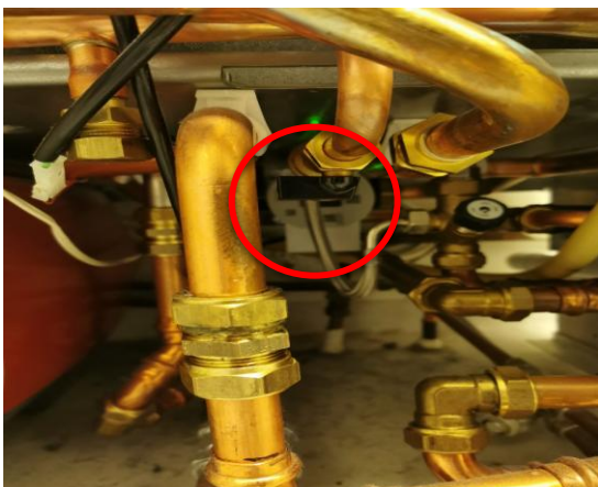
Närbild på påfyllnadskran. Svart kran.